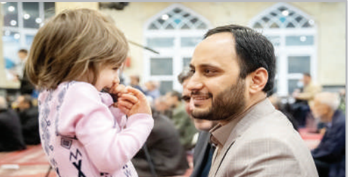
■ در حاشیه سفرانی سخنگوی دولت در مسجد الزهرا (س)