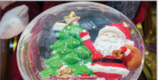
■ حال و هوای سال نو میلادی - تهران