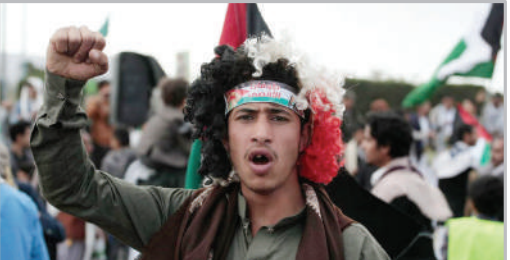
■ تظاهرات بزرگ و صدها هزار نفری در حمایت از فلسطین - شهر صنعا یمن