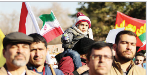
■ مراسم گرامیداشت حماسه ۹ دی