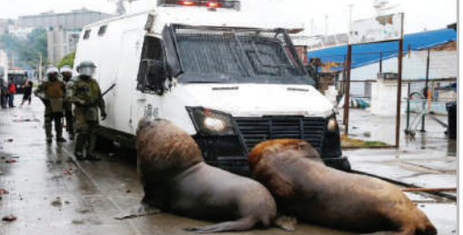
■ شهربانی دریایی مسیر حرکت خودروهای پلیس ضدشورش شیلی را مسدود کرده‌اند.