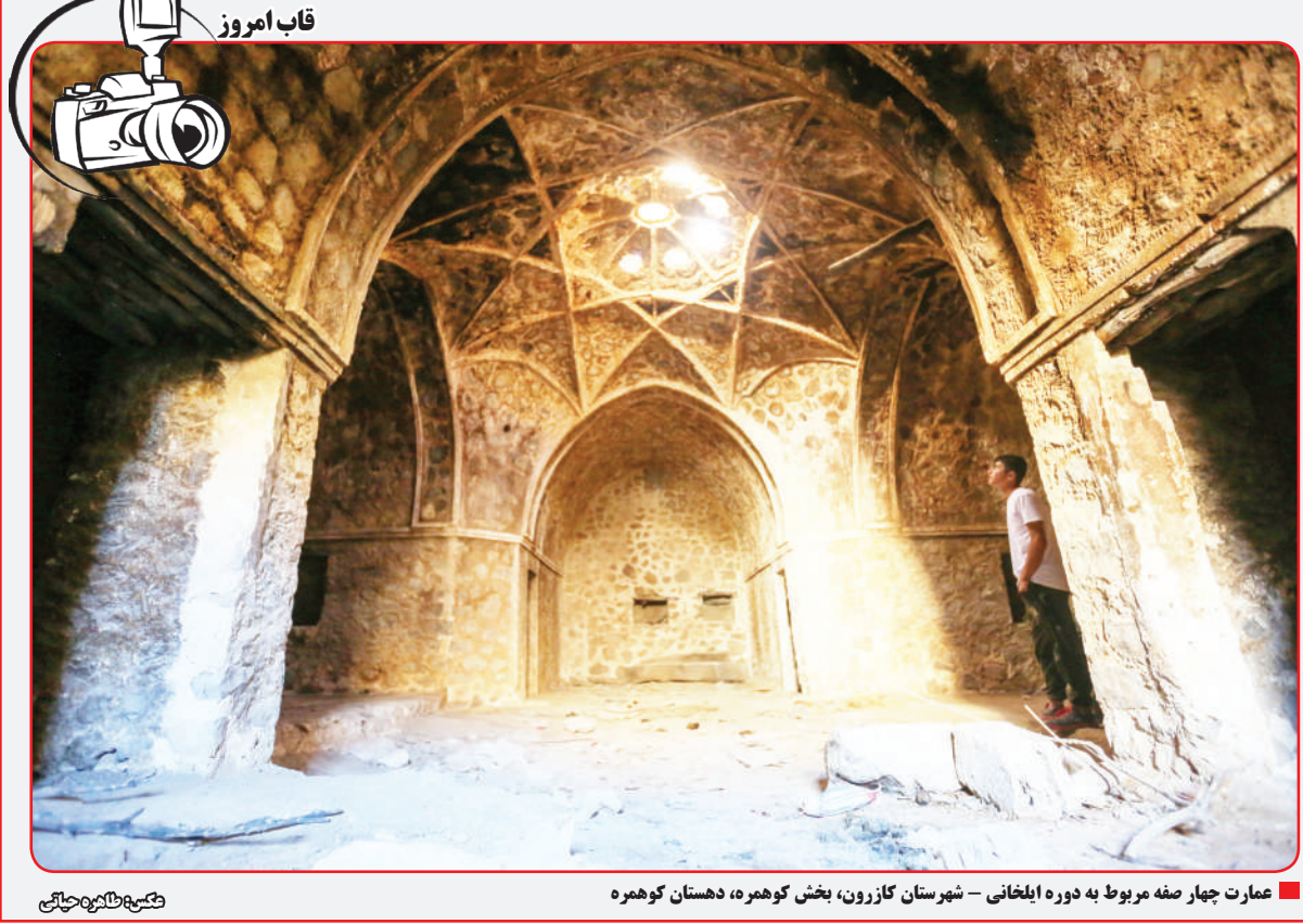
■ عمارت چهار صنفه مربوط به دوره ایلخانی - شیرستان گازرون، بخش گوهره، دهستان گوهره

اغلب تصور می‌شود که انسان‌های امروزی دیگر تکامل را تجربه نمی‌کنند اما اکنون اتفاق نظر بزرگی میان دانشمندان وجود دارد که تکامل هنوز بر گونه انسان تأثیرگذار است و این فرایند حتی سریع‌تر از گذشته روی می‌دهد. در حالی که به نظر می‌رسد اکنون نوآوری‌های فرهنگی و فناوری محرک‌های اصلی تطبیق‌پذیری برای انسان‌های امروز باشند اما این جایگزین تطبیق‌پذیری بیولوژیک نشده است. مایکل گراناتوسکی، بیومکانیست تکاملی گفت: گمان نمی‌کنم این سؤال که آیا انسان‌ها هنوز در حال تکامل هستند، به‌طور کامل توسط عموم مردم درک شود. ادراکات موجود از تکامل دربردارنده عبارت «بقای مناسب‌ترین‌ها» است که به‌طور خودکار یادآور نبردهایی برای یافتن جفت یا نجات گروهی از حیوانات از شرایطی دشوار است. وی افزود: قابل درک است که برخی گمان کنند انسان‌های امروز دیگر تحت فشارهای گزینشی قرار ندارند. اما تکامل به سادگی به معنی تغییر در ذخیره ژنی یک جمعیت با گذر نسل‌ها است. این تعریف کلی گمان نمی‌کنم بحث زیادی در بین بیولوژیست‌های تکاملی در این خصوص وجود داشته باشد که انسان‌ها هنوز در حال تکامل هستند. از یک منظر ژنتیکی، تکامل به عنوان تغییر